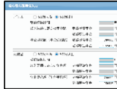
(ねんきん定期便入力)